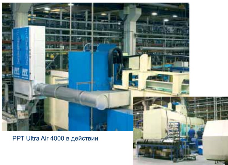
PPT Ultra Air 4000 в действии